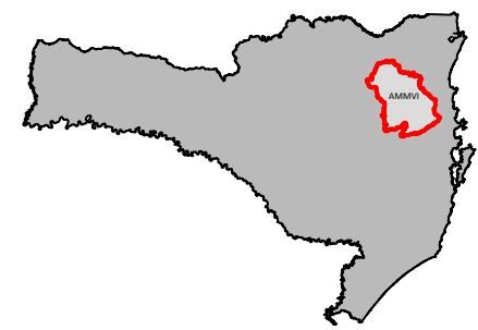
ESTADO DE SANTA CATARINA COM DESTAQUE PARA A REGIÃO DA AMMV