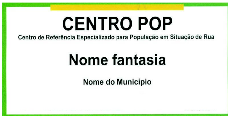
Figura 2: Modelo de Placa do Centro de Referência Especializado para População em Situação de Rua

Independente da (s) fonte (s) de financiamento, a Unidade deverá ter afixada em local visível, placa de identificação com o nome por extenso – Centro de Referência Especializado para População em Situação de Rua (Centro POP). Tal identificação tem como objetivo dar visibilidade à Unidade e fixar, em âmbito nacional, uma mesma nomenclatura e padrão visual, de modo a garantir seu fácil reconhecimento e identificação pelos usuários, pela rede e pela comunidade. Nos municípios ou no Distrito Federal com mais de um Centro POP, poderá ser acrescido na identidade visual um nome fantasia, preferencialmente que faça referência à área de abrangência da Unidade.