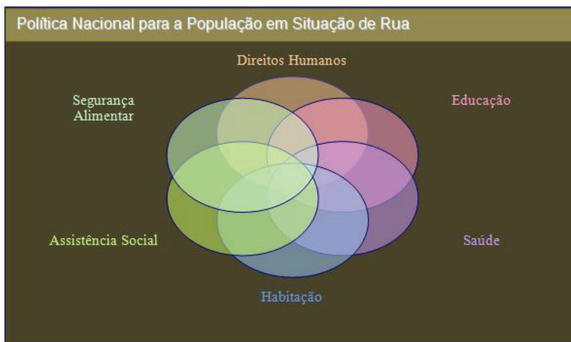
Figura 1: Intersectorialidade da Política Nacional para População em Situação de Rua

cional de ações específicas para cada área, a ser operacionalizada de modo articulado. O Gestor da Assistência Social deve, portanto, participar do Comitê Gestor Intersectorial local e, se for o caso, estimular sua criação.