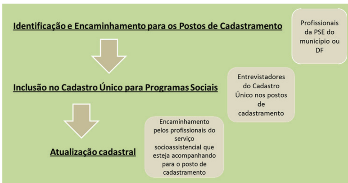
Figura 3: Etapas para a inclusão das pessoas em situação de rua no Cadastro Único para Programas Sociais do Governo Federal.

Veja abaixo o fluxo das etapas necessárias à inclusão das pessoas em situação de rua no Cadastro Único para Programas Sociais do Governo Federal: